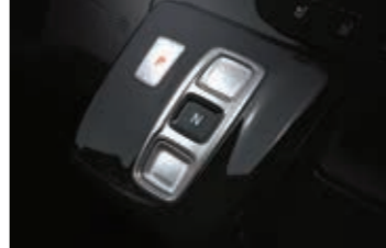
Elektronik vites paneli (E)