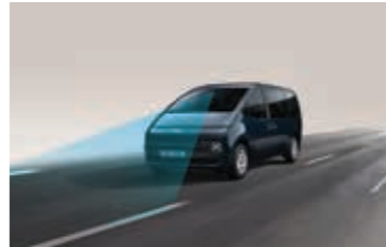
Şerit takip asistanı ve şeritte kalma asistanı (LFA ve LKA) (E)