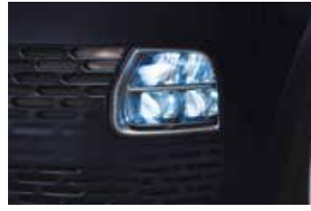
LED ön farlar