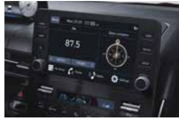
8" multimedya ekranı