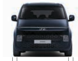
Ön İz Genişliği: 1.721 Toplam Genişlik: 1.997