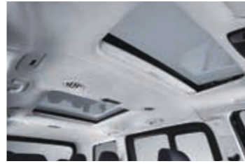
Elektrikli açılır cam tavan (E)