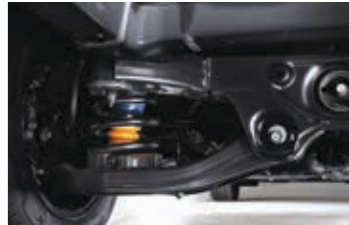
Çok noktadan bağlantılı arka süspansiyon Gelişmiş mekanik sayesinde sürüş konforu sağlar.