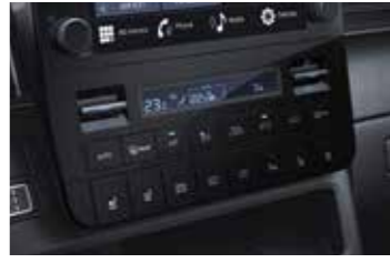
Otomatik klima ve yolcu bölümünde ilave klima kontrol paneli