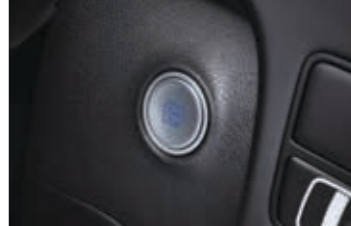
Anahtarsız giriş ve çalıştırma sistemi