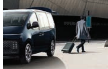
Akıllı bagaj kapağı (E)