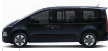
Aks Mesafesi: 3.273 Toplam Uzunluk: 5.253