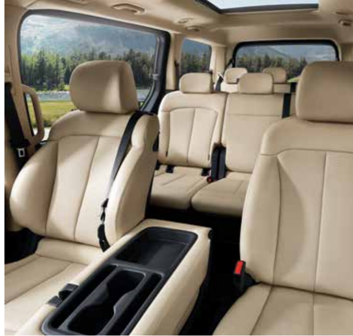
Görseller Türkiye pazarında satışa sunulandan farklılık gösterebilir.