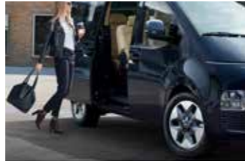
Elektrikli sağ ve sol kayar kapılar