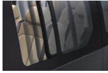
Yan sürgülü camlar