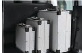
Bagaj hacmi: 1.303ℓ(VDA) (2. ve 3. sıra koltuklar öne kaydırıldığında.) • 2. sıra : 100mm • 3. sıra : 400mm öne kaydırabilir.