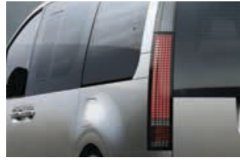
LED arka lamba kombinasyonu (E)