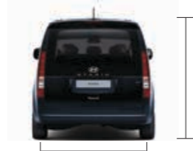
Arka İz Genişliği: 1.732 Toplam Yükseklik: 1.990