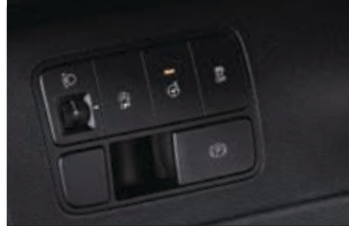
Elektrikli park freni