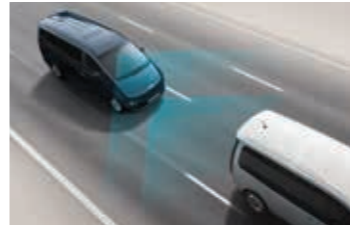
Ön çarpışma engelleme asistanı (FCA) (E)